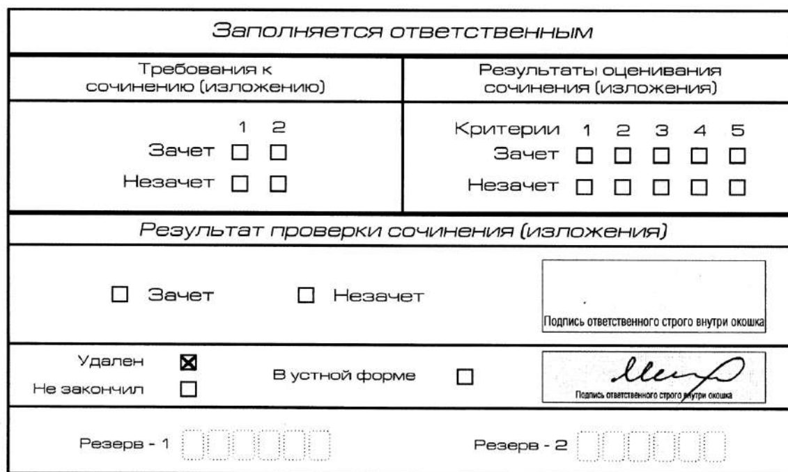
Рис. 13. Заполнение полей нижней части бланка регистрации (удаление с экзамена)

В случае если участник итогового сочинения (изложения) нарушил установленные требования, изложенные в п. 27 Порядка проведения государственной итоговой аттестации по образовательным программам среднего общего образования (приказ Минпросвещения Российской Федерации и Рособрнадзора от 07.11.2018 г. №190/1512), он удаляется с итогового сочинения (изложения). Член комиссии по проведению итогового сочинения (изложения) составляет «Акт об удалении участника итогового сочинения (изложения)» (форма ИС-09), вносит соответствующую отметку в форму ИС-05 «Ведомость проведения итогового сочинения (изложения) в учебном кабинете ОО (месте проведения)» (участник итогового сочинения (изложения) должен поставить свою подпись в указанной форме). В бланке регистрации указанного участника итогового сочинения (изложения) необходимо внести отметку «X» в поле «Удален». Внесение отметки в поле «Удален» подтверждается подписью члена комиссии по проведению итогового сочинения (изложения).