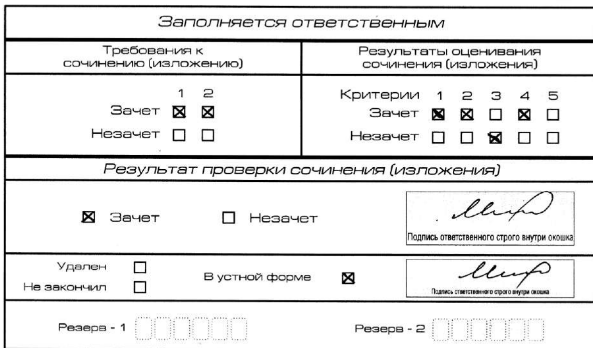
Рис. 11. Область для оценки работы сочинения (изложения) в устной форме

После окончания заполнения бланка регистрации ответственное лицо ставит свою подпись в специально отведенном для этого поле.